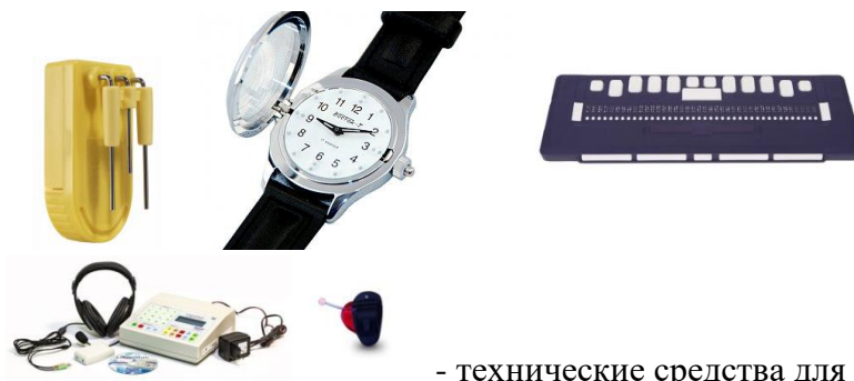
- технические средства для лиц с нарушениями слуха

Ответ: Выбор 3-х средств, представленных ниже (5 баллов)